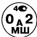
Рисунок А.1 - Поверительное клеймо ЦСМ