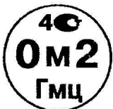
Рисунок А.2 - Поверительное клеймо ГНМЦ