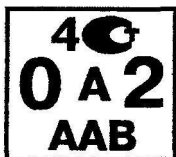
Рисунок А.4 - Поверительное клеймо, применяемое метрологической службой юридического лица при клеймении средств измерений, находящихся в эксплуатации или после ремонта